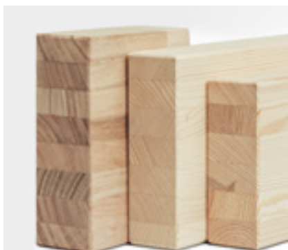
Montants et traverses traditionnels

Dans le domaine du revêtement, il existe de multiples possibilités : différentes essences de bois (sur demande) ou aspect inox.