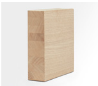
Montants et traverses Premiumline