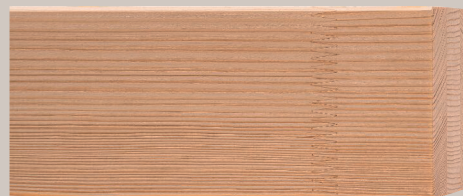
Carrelet NO LIMITS épicéa non traité

Les joints aboutés à peine visibles sont réduits à leur taille minimum irréductible et n'altèrent l'homogénéité visuelle que de façon minime.