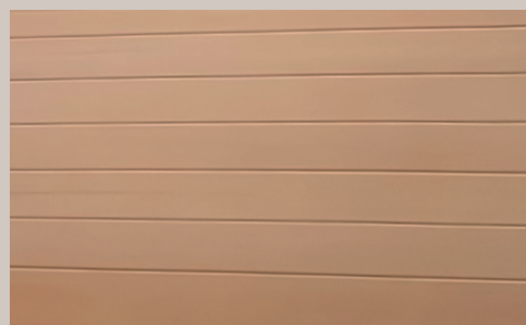
Carrelet NO LIMITS épicéa à surface traitée, joints aboutés à peine visibles

Le bois, matériau naturel, avec toutes ses propriétés et ses particularités positives est pris en compte et nous pouvons garantir une fourniture durable aujourd'hui et demain.